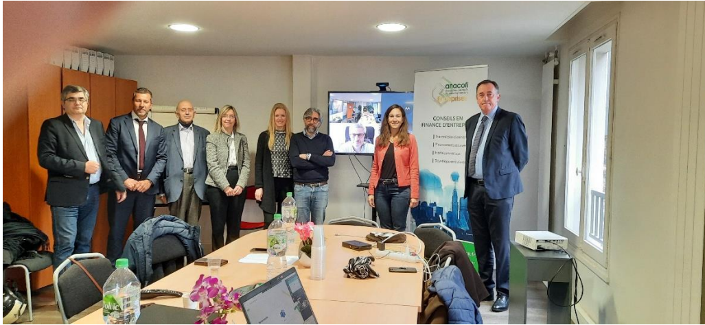
Mai 2022. Seconde réunion de la Commission Finance d'Entreprise.